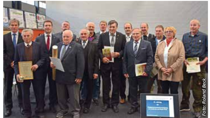
Ehrung in der Schulturnhalle Roßtal