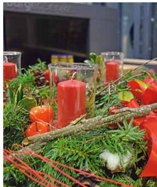
Im Landratsamt herrscht Weihnachtsstimmung