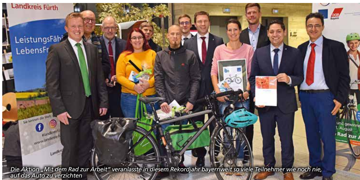
Die Aktion „Mit dem Rad zur Arbeit“ veranlasste in diesem Rekordjahr bayernweit so viele Teilnehmer wie noch nie, auf das Auto zu verzichten