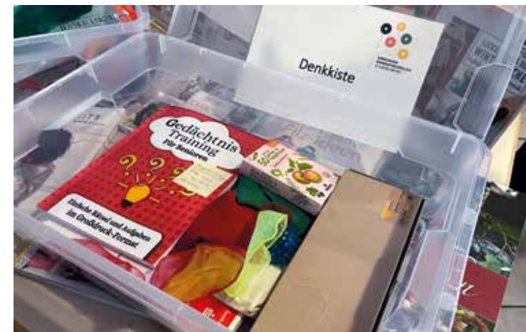
In den Boxen befinden sich Informationen und verschiedene Denkaufgaben