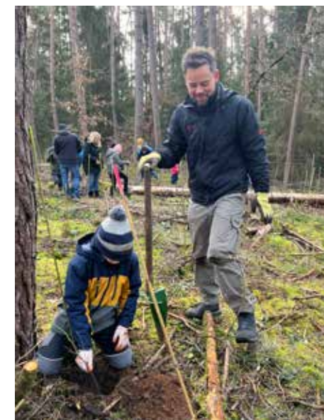
In sieben Jahren sollen die Bäume bereits eine gewisse Größe erreicht haben