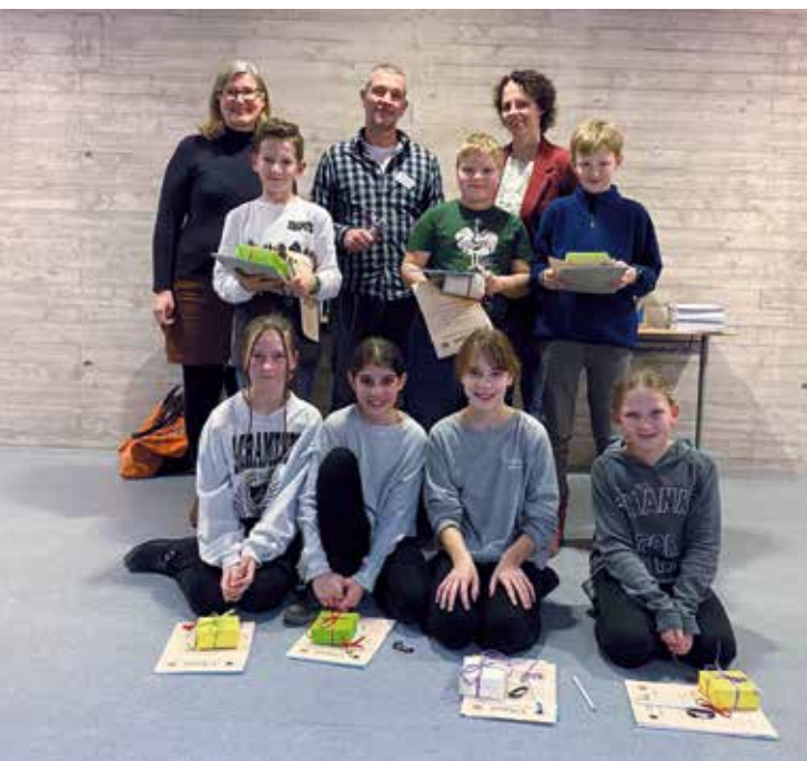
An der Langenzenner Realschule konnte geforscht und ausprobiert werden

Warum brennt denn da noch Licht in der Schule?: Diese Frage hat sich der eine oder andere sicherlich gestellt, als er im Klaushofer Weg unterwegs war. Und wer genau hinhörte, hat bestimmt Schüler lachen und rätseln hören. Denn: An der Realschule Langenzenn wird geforscht.