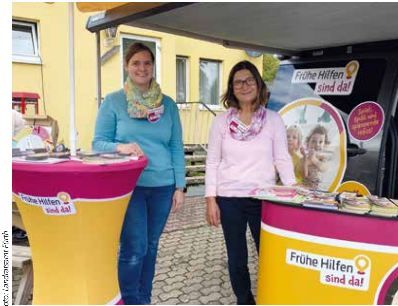
Die Koki-Expertinnen beantworten Fragen am 12. Juli in Roßtal

ein Kleinbus, der mit einem bundesweiten Modellprojekt „Mobile Frühe Hilfen“ finanziert wird. Im KoKi-Bus gibt es die Möglichkeit, sich beraten zu lassen und auch andere Eltern kennenzulernen. Außerdem werden viele Angebote für Spaß, Spiel und Genuss für Familien und Ihre Kinder angeboten. Und mit etwas Glück gibt es tolle Preise zu gewinnen.