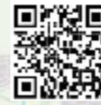
Fahrplan der Linie 113

Die Firma Schmetterling Reisen befördert Sie auf dieser Linie in modernen Niederflurbussen inklusive WLAN Ausstattung und wünscht Ihnen eine gute Fahrt!