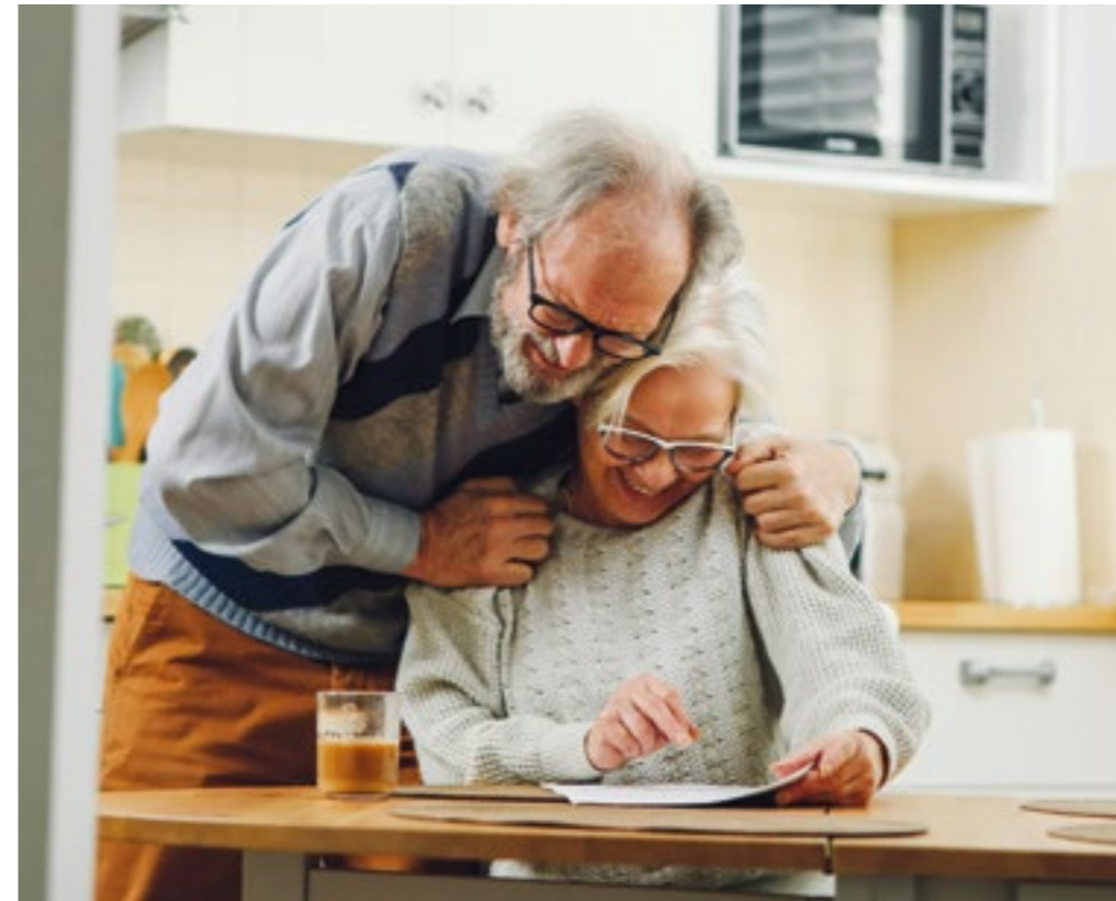
So lange wie möglich Zuhause wohnen

Der Landkreis Fürth nimmt an der bayernweiten Initiative „Zu Hause daheim“ teil, die vom Bayerischen Sozialministerium ins Leben gerufen wurde.