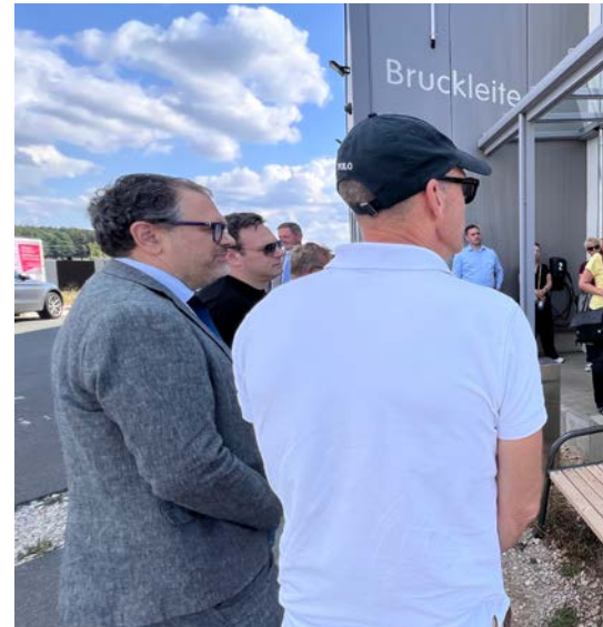
Eindrücke von der ersten Veranstaltung „Walk & Talk“ in Veitsbronn